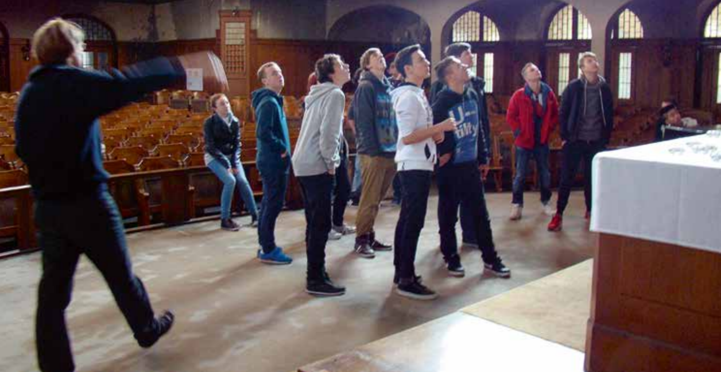
Workshop „Kirche erforschen“