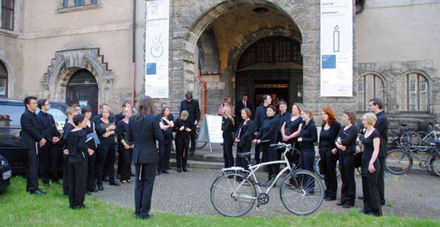
Chor vor dem Auftritt