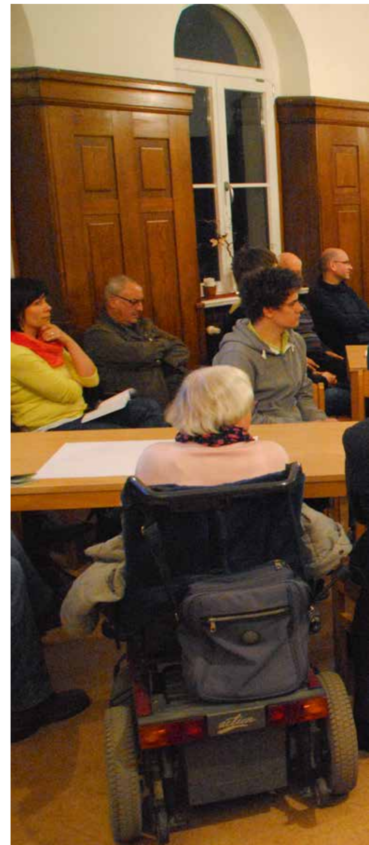
Themenabend „Asyl & Heimat“

„Als Philippus Leipzig das Haus wieder belebte, nahm ich die Angebote gerne an. Seitdem bin ich regelmäßig Besucherin und hoffe, dass auch in der Zukunft dieses Haus ein so buntes, ansprechendes Programm aufrechterhalten wird und baulich die bestehenden Möglichkeiten weiter verfeinert.“