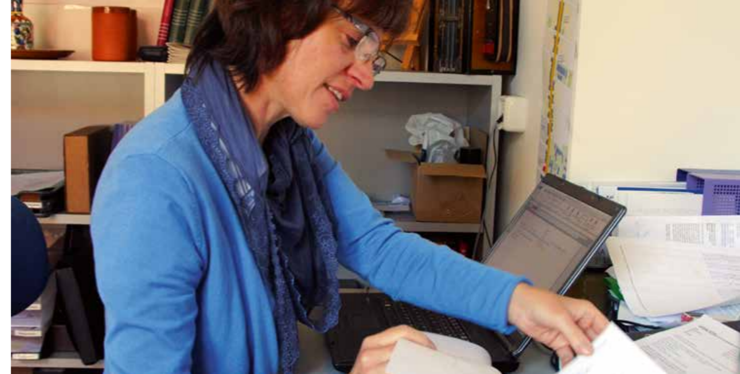
Mitarbeiterin im Projektbüro Philippus

Die Leipziger Hotellerie ist hauptsächlich im Stadtzentrum angesiedelt. 186 Unterkünfte, davon 26 mit drei Sternen, stellen den Markt dar, in den sich Philippus integrieren will. Im unmittelbaren Umfeld wurden drei Hotels mit unterschiedlichen Klassifizierungen als Mitbewerber eingeschätzt. Mit ihnen liegt Philippus innenstadtnah, wenn auch nicht im touristischen und wirtschaftlichen Zentrum Leipzigs.