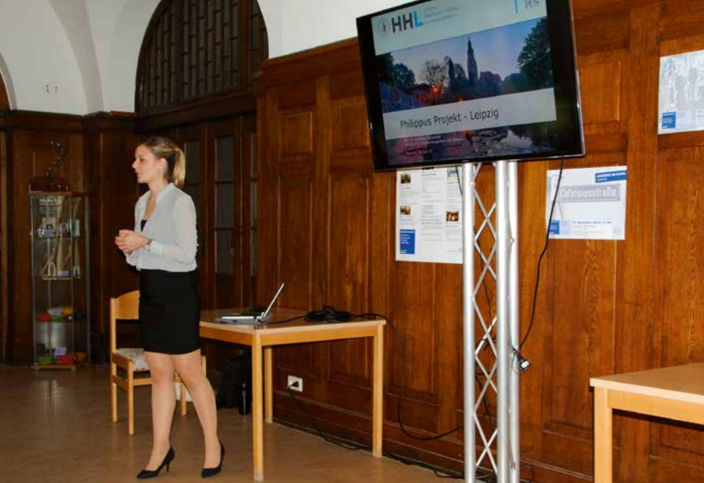
Präsentation der Handelshochschule