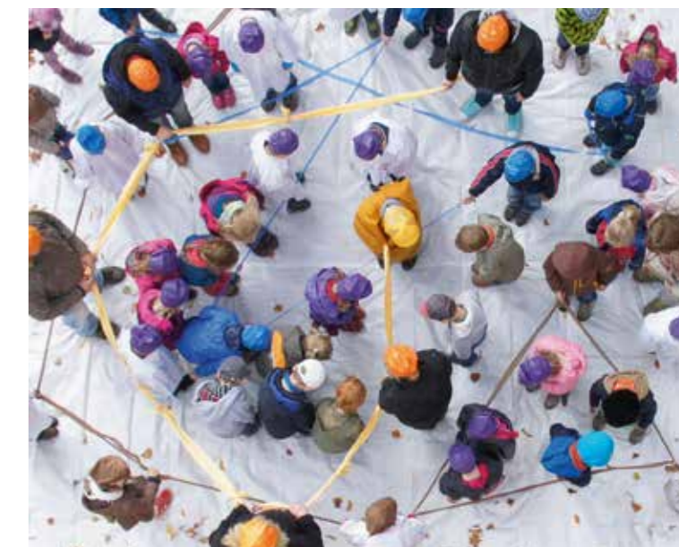
Kinder stellen ein abstraktes Bild nach