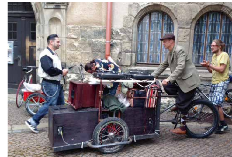
Mit Tanzbein zu Gast

Die Gründe für die wachsende Bedeutung Leipzigs liegen verschiedenen Studien zufolge in der verkehrsgünstigen Lage, der Vielfalt an kulturellen, sportlichen, Sightseeing- und Shoppingattraktionen sowie einem florierenden Messe- und Kongressangebot. Innerhalb der letzten 10 Jahre stiegen die Übernachtungszahlen von Leipzig um rund 65 Prozent.