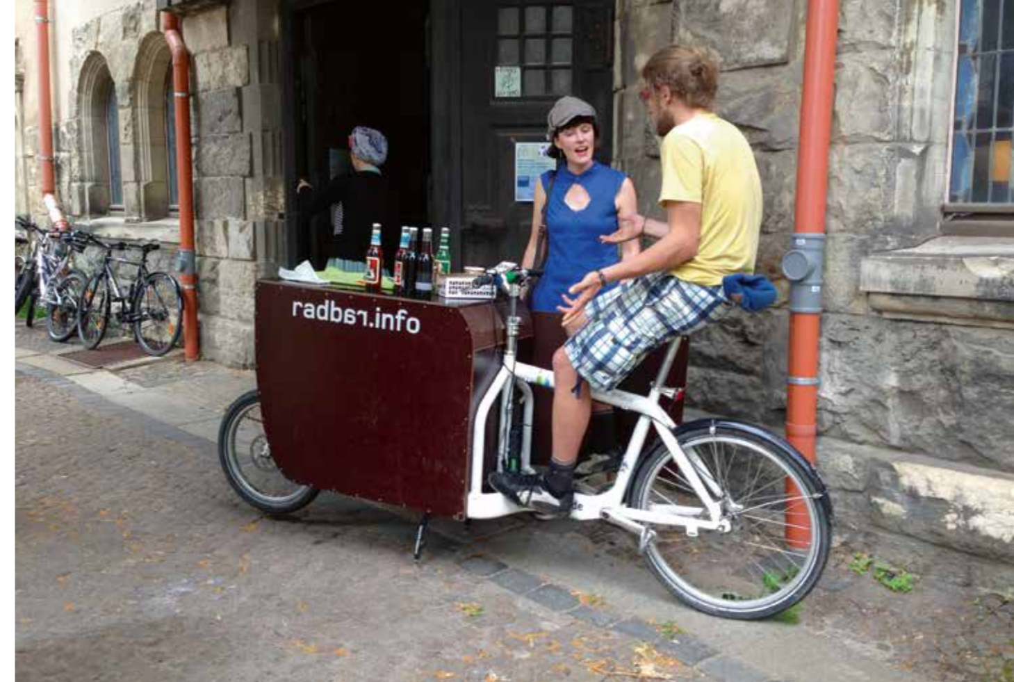
Nachbarn auf zwei Rädern