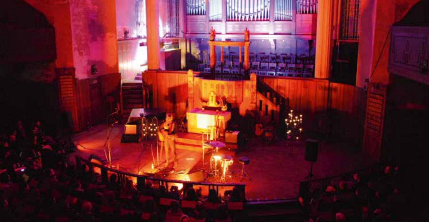
music with friends