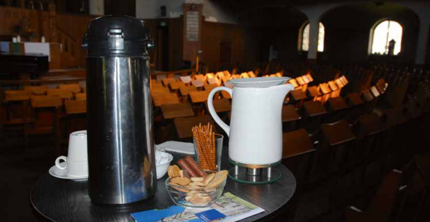
Stärkung der Teilnehmer am Ausgang