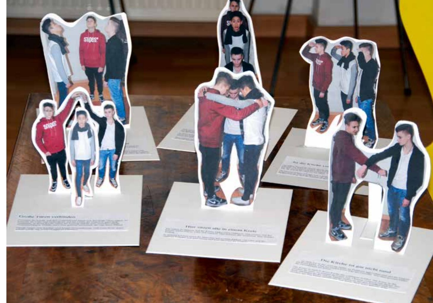
Standbilder zur Innenarchitektur von Philippus