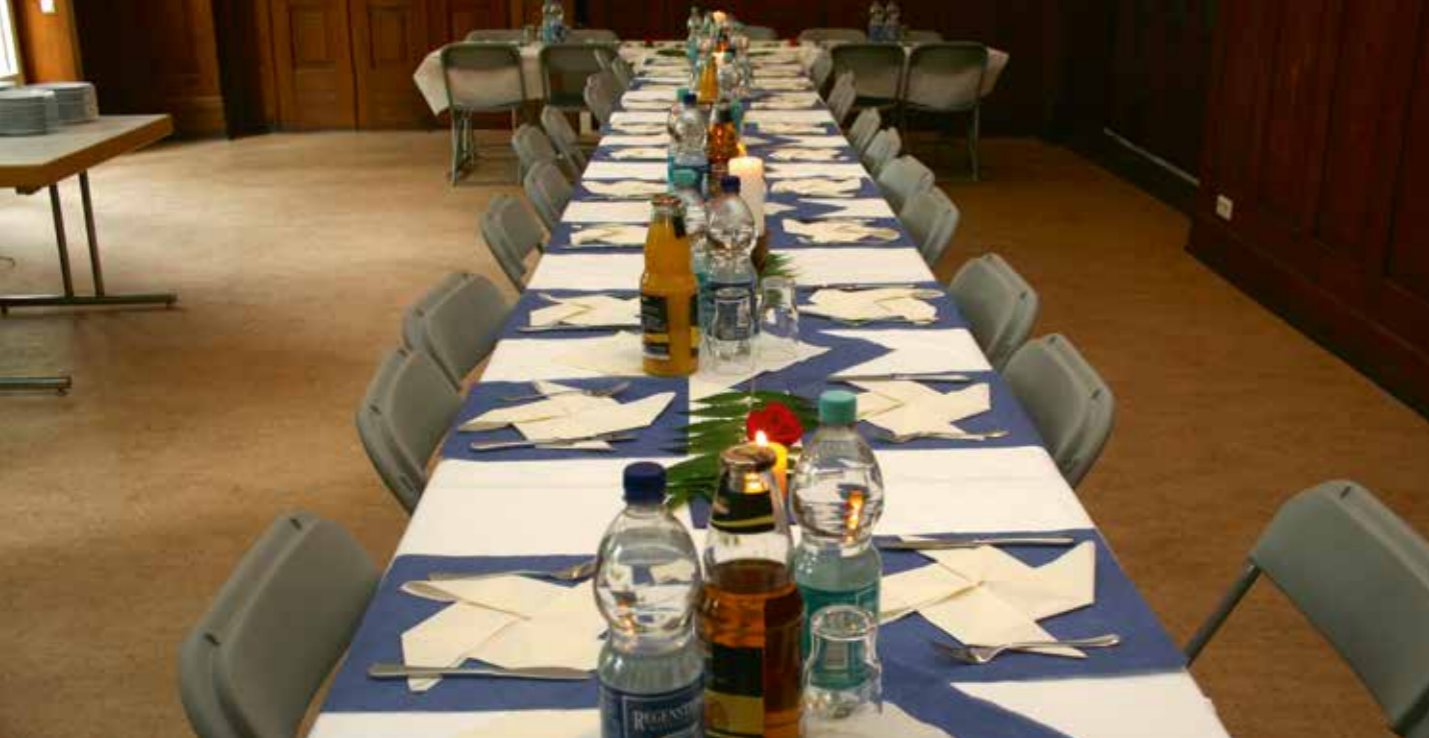
Tische für eine Seminargruppe